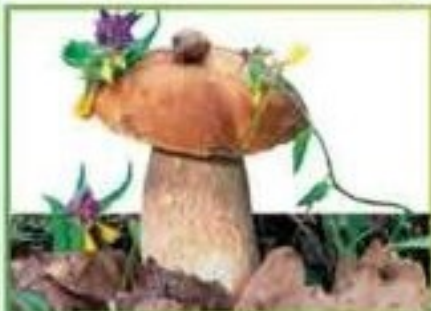
белый гриб (еловый)