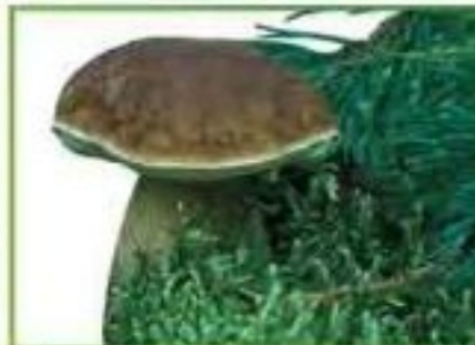
белый гриб (сосновый)