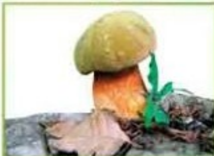
белый гриб (дубовый)